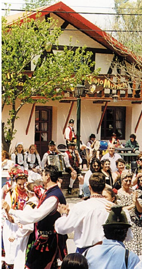
FIESTA NACIONAL DE LA CERVEZA