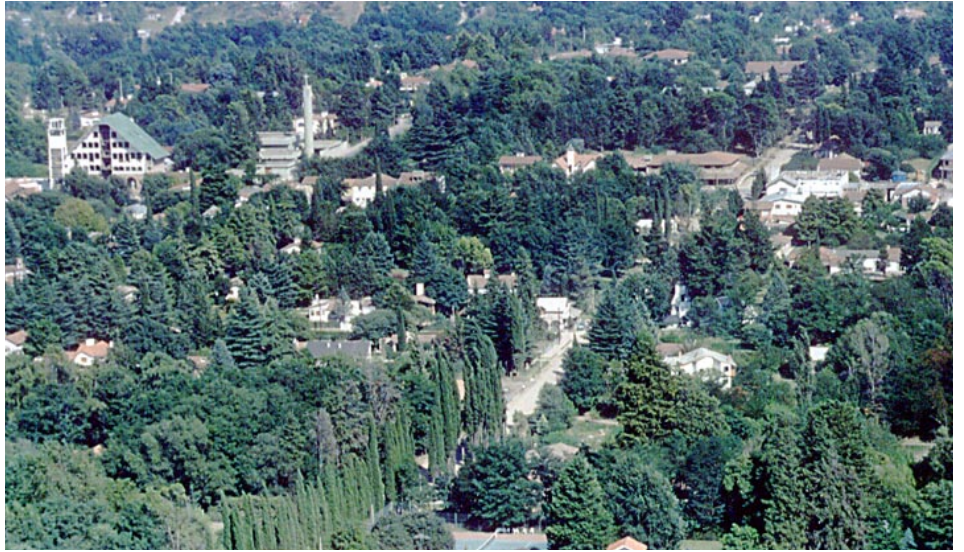
VISTA PANORAMICA DE VILLA GRAL. BELGRANO, RODEADO DE SUS PINARES.